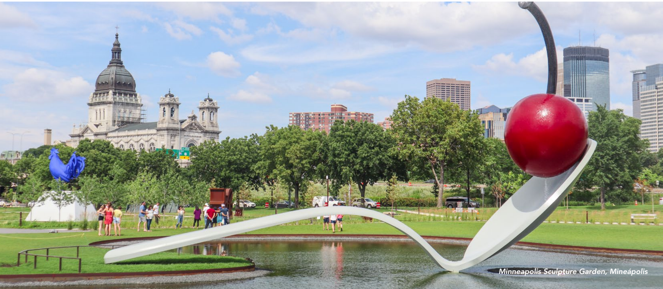
Minneapolis Sculpture Garden, Mineápolis