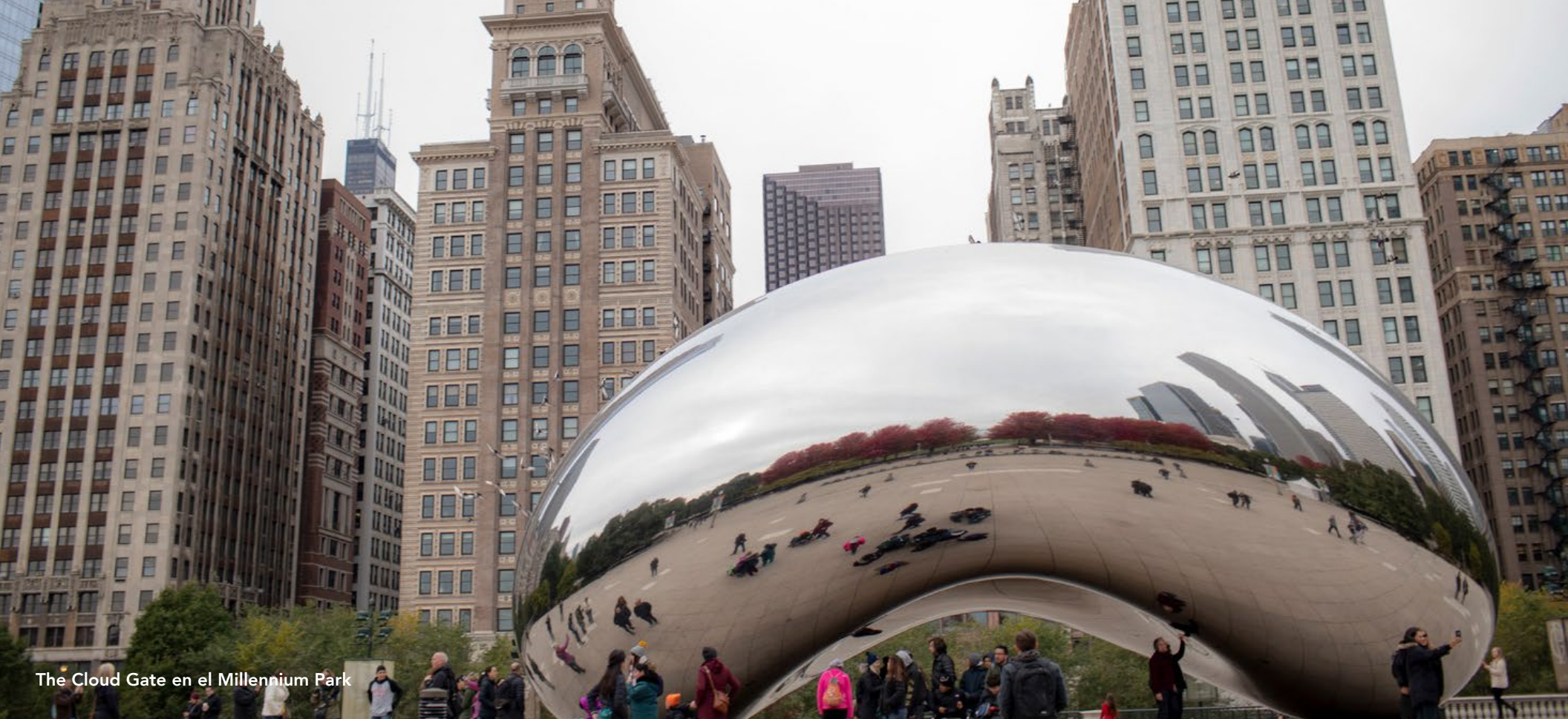
The Cloud Gate en el Millennium Park