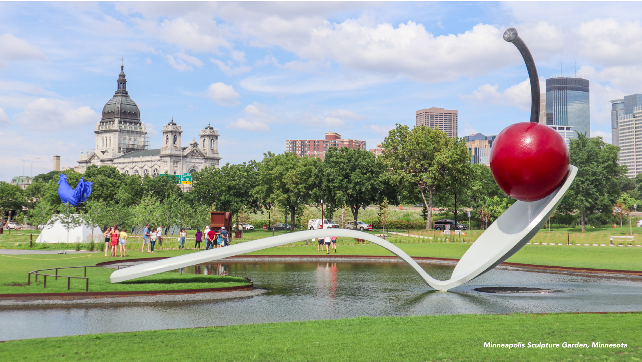
Minneapolis Sculpture Garden, Minnesota