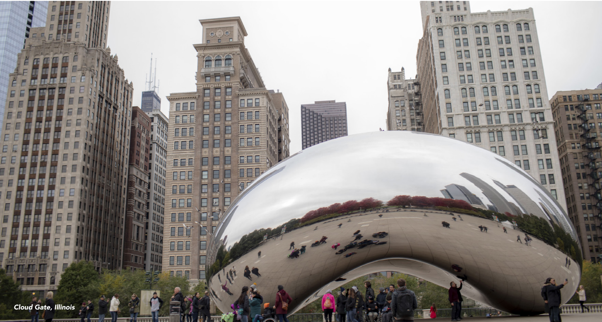
Cloud Gate, Illinois

Si buscas más inspiración e ideas para viajar por Estados Unidos, ingresa a: VisitTheUSA.com